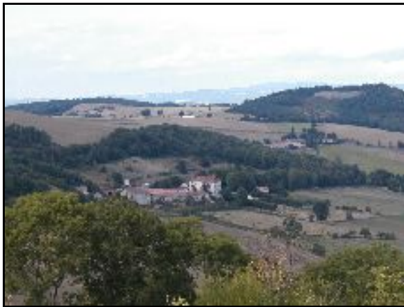
Au cœur du cratère d'Alleret, alt. 650m Le Château d'accueil

Le Château fut construit à la fin du XIXe siècle, au sein même du cratère d'Alleret. Il offre ainsi une vue superbe sur un paysage de cultures bordées de forêts ; vaste cratère d'environ 2 km de diamètre en pente adoucie, résultat d'une explosion évaluée à 3 millions d'années !